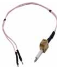
Спираль газового поджига для аппарата ТВ3/ТВО-ЛАБ-11/12