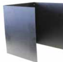
Защитный экран для аппаратов ТВО/ТВ3