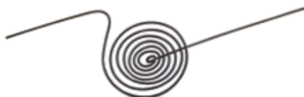
Нагревательный элемент для ТВО-ЛАБ-01