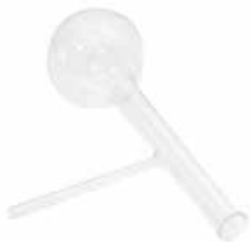
Колба Энглера (125 мл) для АРН-ЛАБ