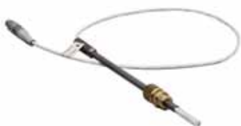
Термодатчик Pt-100 для аппарата ТВ3-ЛАБ-01