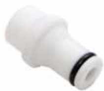
Устройство центрирующее для аппарата АРН-ЛАБ-03 для термометров ТИН, ASTM