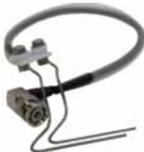
Детектор вспышки ТВО-ЛАБ-11/12