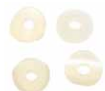
Уплотнитель соединения отвода колбы с холодильником АРН-ЛАБ (50 шт.)