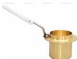
Тигель без крышки для аппарата ТВ3-ЛАБ-01/11/12