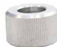
Втулка резьбовая для аппаратов АРН-ЛАБ