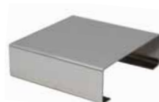
Подставка под приемный цилиндр АРН-ЛАБ-03