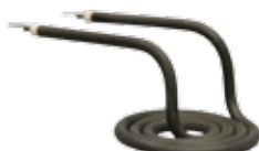
Нагревательный элемент для аппарата ТВ3/ТВО-ЛАБ-11/12 и ТВ3-ЛАБ-01