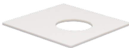
Подставка стеклокерамическая для колбы Энглера АРН-ЛАБ, отв. 50 мм