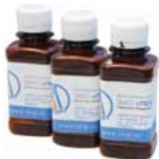
Набор ГСО «Фракционный состав»: ГСО ФС-Б-НС(36-187 °С) ГСО 9468-2009 (флакон, 110 мл) ГСО ФС-РТ-НС (148-225 °С) ГСО 9470-2009 (флакон, 110 мл) ГСО ФС-ДТ-НС (193-360 °С) ГСО 9469-2009 (флакон, 110 мл)