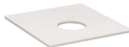
Подставка стеклокерамическая для колбы Энглера АРН-ЛАБ, отв. 38 мм