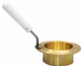
Тигель для аппарата ТВО-ЛАБ-01/11/12