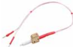
Спираль электрического поджига для аппарата ТВ3-ЛАБ-11/12