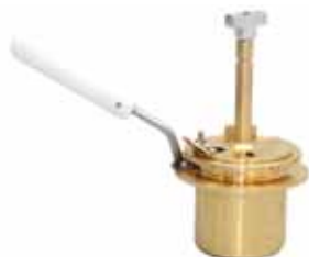
Тигель с крышкой для аппарата ТВ3-ЛАБ-01