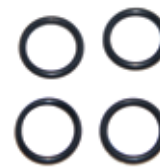
Комплект витонových колец для центрирующего устройства АРН-ЛАБ -11 (4 шт.)