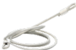
Шомпол для чистки трубки блока конденсации